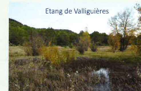
Etang de Valligüières

« Les études environnementales intègrent une analyse de la biodiversité et de toutes les espèces floristiques et faunistiques locales. Prenons l'exemple du triton crêté, élément à forte valeur patrimoniale pour le secteur. Nos premières études montrent que cette espèce reste liée à l'étang de Valligüières et ne sera probablement pas concernée par des emprises sur les reliefs calcaires du plateau. »