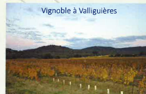
Vignoble à Valligüières

« Le principal c'est de se parler, de maintenir le lien avec le maître d'ouvrage »